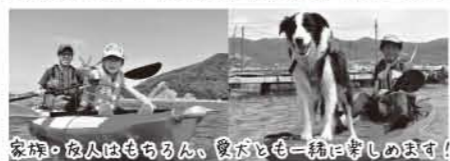
家族・友人はもうるん、愛犬はもう一緒に楽しむのびます!

「じゃのひれシーカヤック&SUP」は「淡路じゃのひれアウトドアリゾート」内にある、マリナクティビティ体験施設です。ここではボートに座って漕ぐ「シーカヤック」、立って漕ぐ「SUPパドルボード」をお楽しみいただけます。専門スタッフがしっかりレクチャーするので、お子様や泳ぎに自信がないという方でも大丈夫! この夏の思い出づくりに、地元淡路の海を目一杯楽しんでみませんか?お気軽にお問い合わせください!