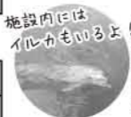
施設内にはイルカもいるよ!

どちらのコースにも専門ガイドが同行。(シーカヤックコースには日本セーフティカヌーイング協会(JSCA)公認ガイドが同行します)安全に配慮しつつ、福良湾をご案内します!