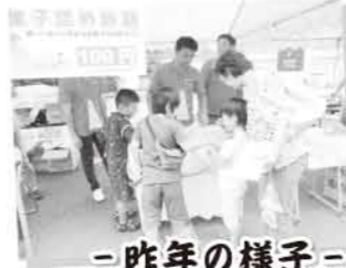
- 昨年の様子 -