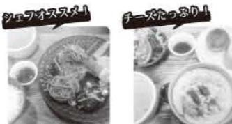
ルシャノワールランチ 本日のグラタン set ¥800 (税別) ¥900 (税別)